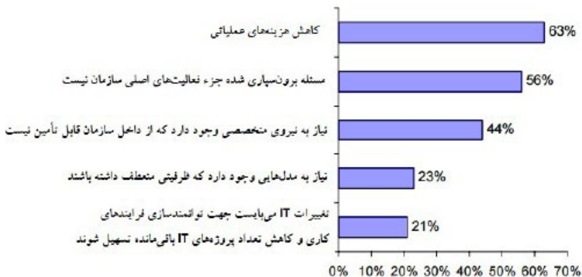
نیروهای محرک در استفاده از رویکرد برون‌سپاری

بر اساس بررسی گروه Aberdeen ۶۳٪ از سازمان‌ها عامل کاهش هزینه‌های عملیاتی را به عنوان دلیل اصلی برون‌سپاری مطرح کردند. علت‌های مهم دیگری که سازمان‌ها برای استفاده از این رویکرد ذکر کردند، عدم دسترسی به نیروی انسانی متخصص برای توسعه نرم‌افزار در زمان مناسب و با صرف هزینه مناسب است و مشکلات دیگر مربوط به الزام تخصیص زمان تیم IT برای انجام پروژه‌های مربوط است.